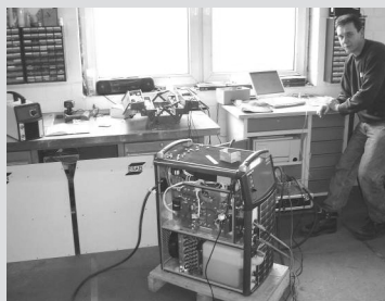
Reparatur durch eigenen Service.