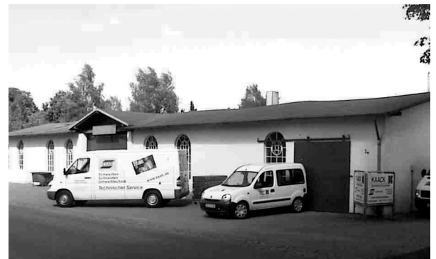
Firmengelände und Fuhrpark.

wurde das Handelshaus Mitglied beim E/D/E und Konzeptpartner Schweißtechnik.