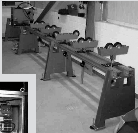
Sondermaschinen: Drehvorrichtung für Werftkunden.